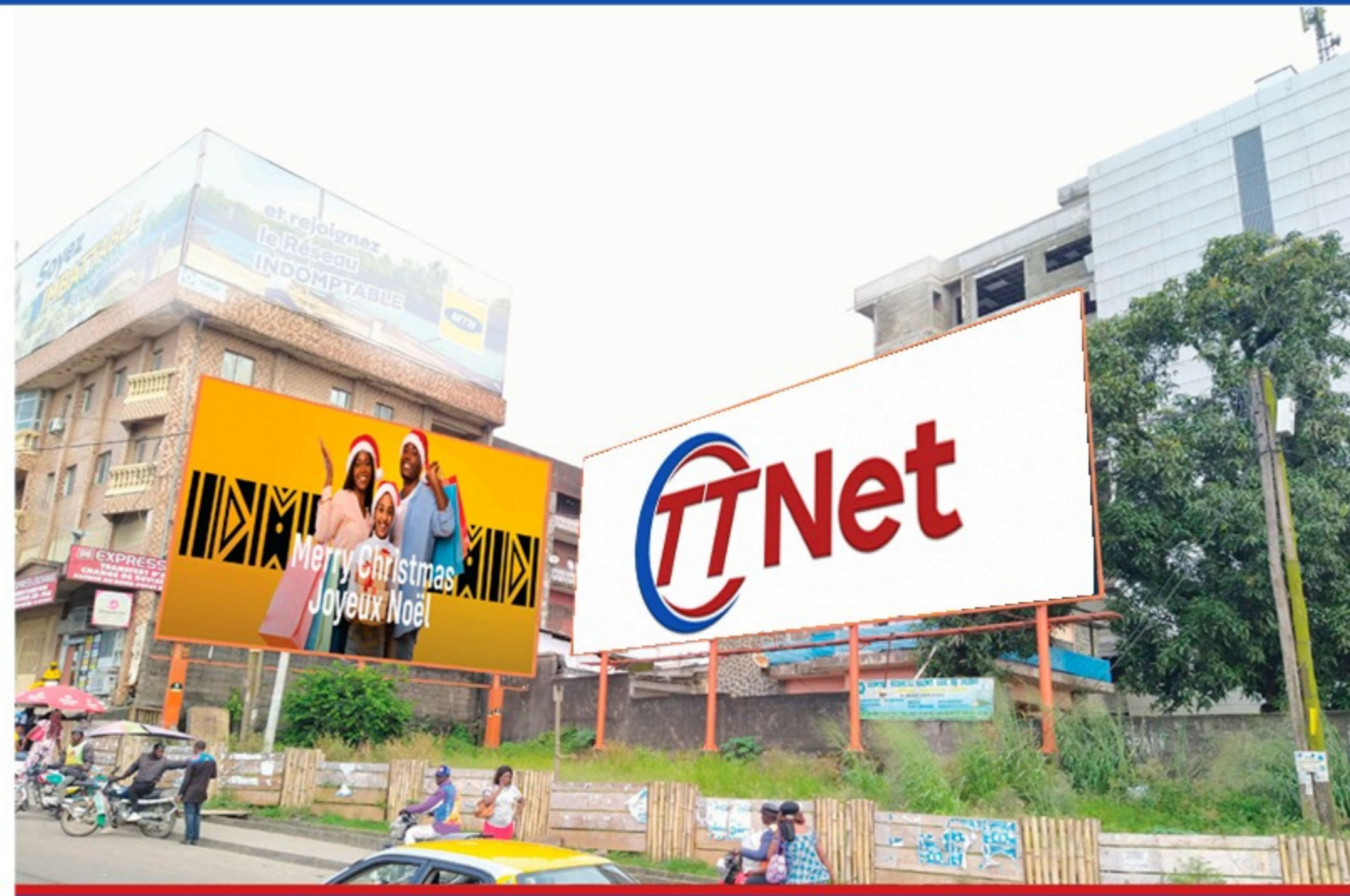
ROUND POINT - DEIDO 12,5m X 8m = 100m 2 Une face