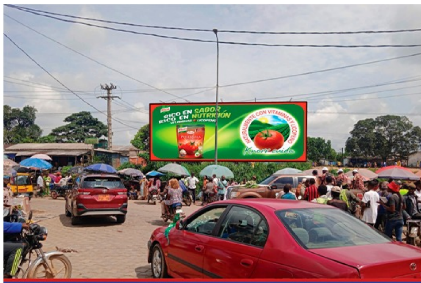
Marché Nyalla 16,67m x 6m Une face