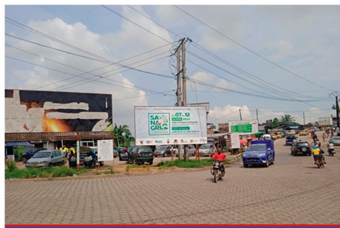
Carrefour cité de palmier 6m x 3m Une face