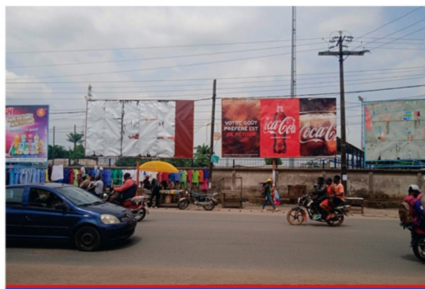
Palais de justice Ndokoff 6m x 3m Une face