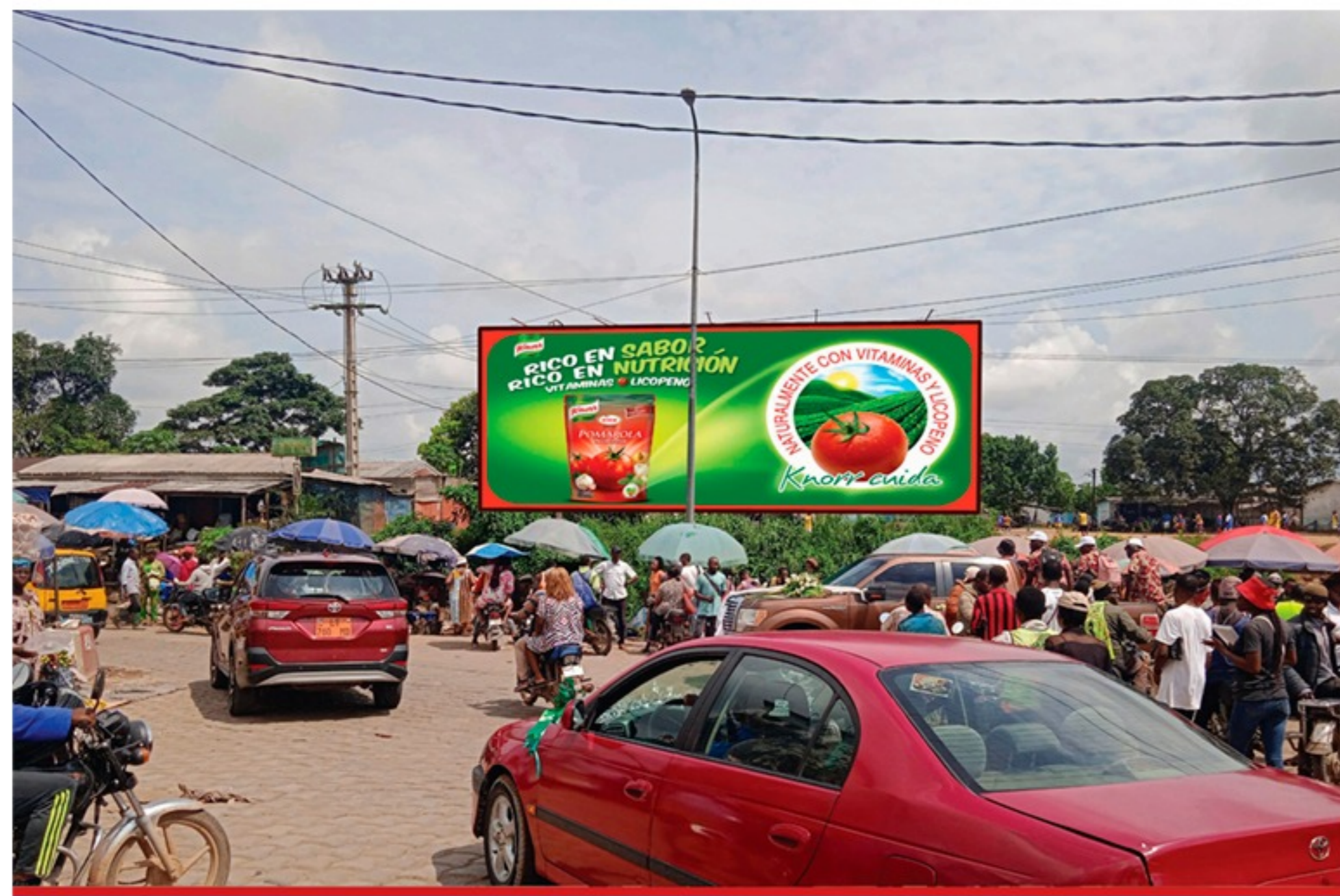
GPS : 4.032873, 9.789088