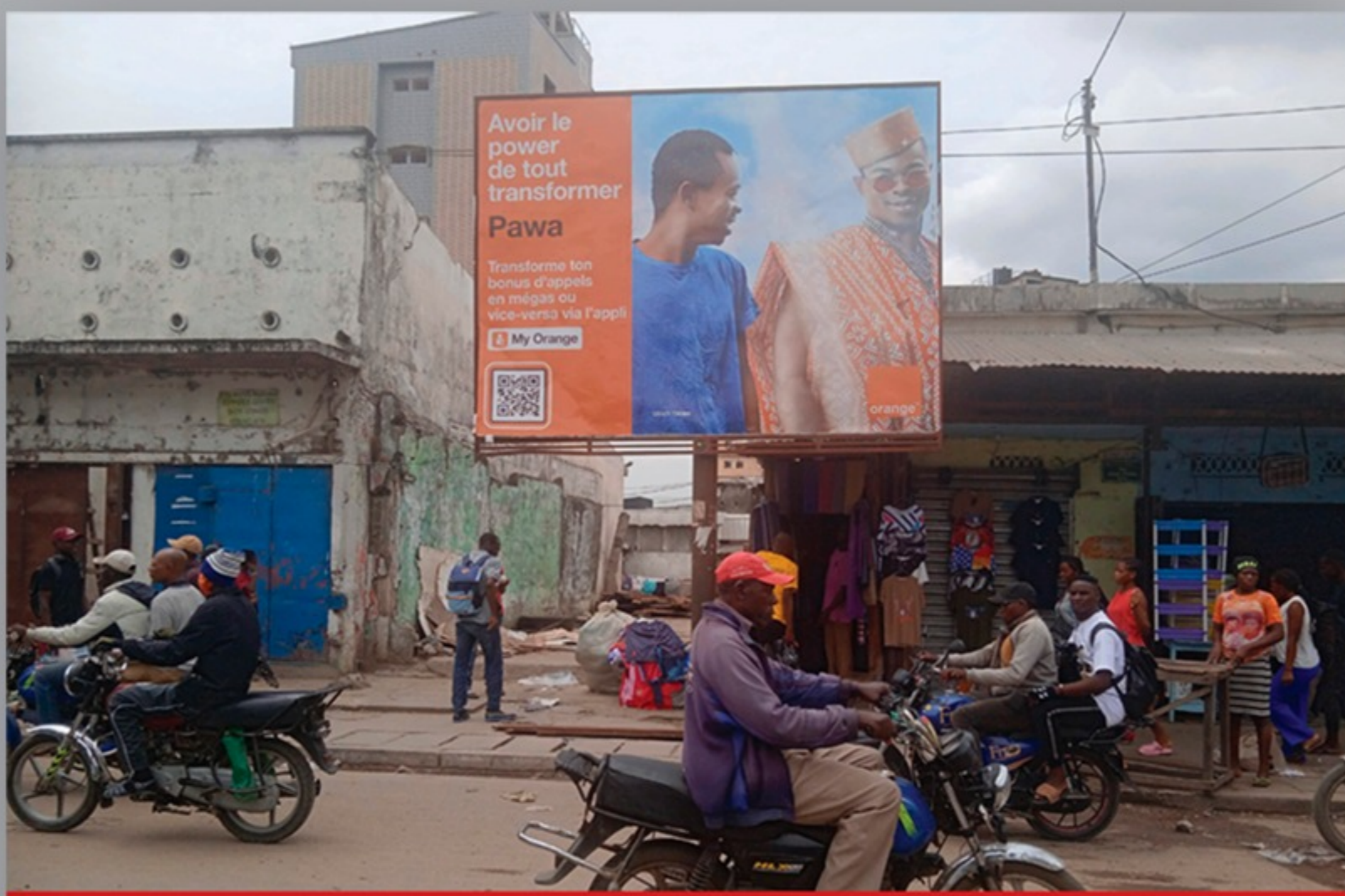
GPS : 4.040096, 9.702816